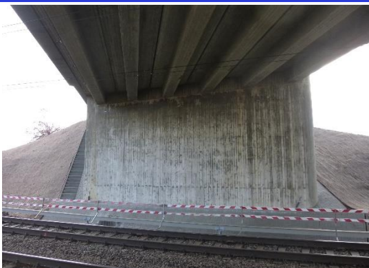
Ansicht Widerlager Achse 20