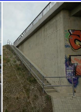
Böschungstreppe mit Geländer